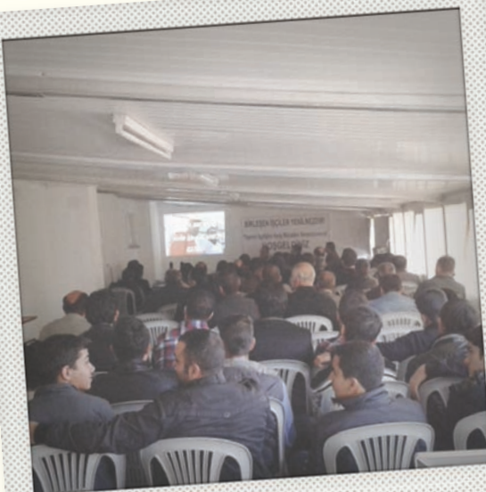
Taşeron İşçiliğe Karşı Mücadele Sempozyumu 27 Ekim 2013