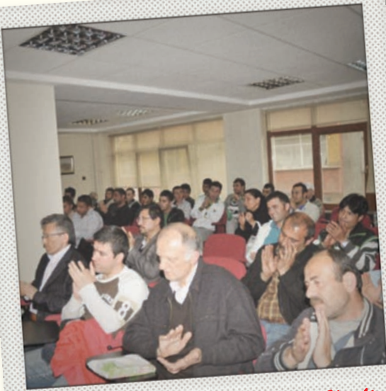
3. Kayseri İşçi Kurultayı 17 Nisan 2011