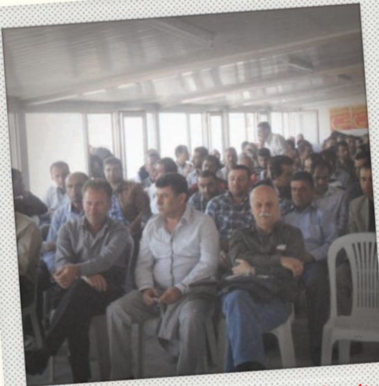
Sınıf Karşı Sınıf Kurultayı 14 Nisan 2013